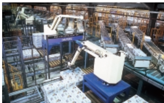
みかん収納ケースをパレットに積み付け。“オートパレタイジングシステム”