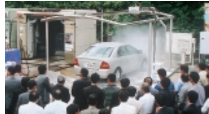
全く新しい発想の洗車機「シャワースピナー」を披露(洗車ビジネスフェア)