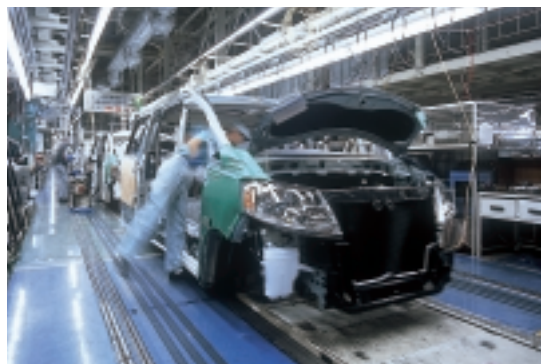
自動車生産システム。“パワーローラーベッド”