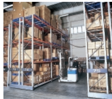
キャラクターグッズを保管。重量級移動棚“移動ラック”