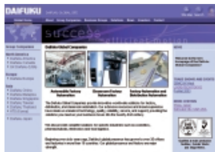
グローバルホームページ( http://www.daifuku-world.com )