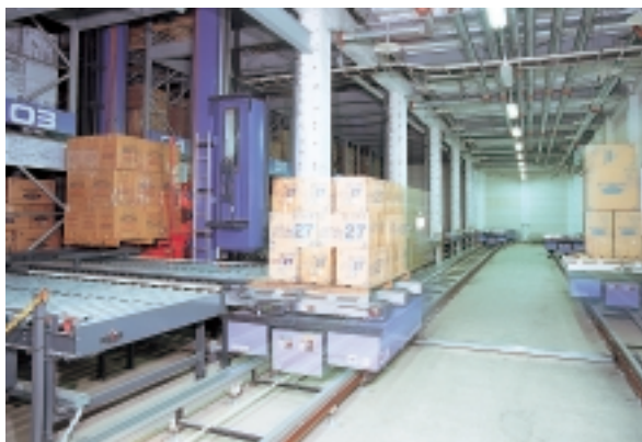
ホームセンター向け商品を格納。建屋一体型自動倉庫“ラックビルシステム”