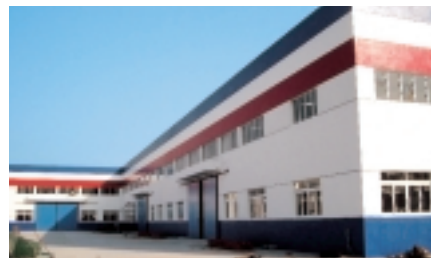
中国での委託生産工場

海外向け案件のウェイトが高くなってきたため、現地法人が独自に運用してきたホームページを統合。DAIFUKUブランドの世界規模でのイメージアップ、ITと融合させたマーケティングを展開します。