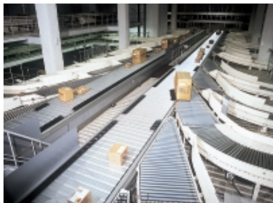
宅配便を出荷方面別に仕分け。“ジェットサーフィンソーター”