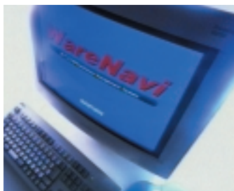
物流センター管理システム。WMS“ウェアナビ”