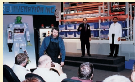
ProMat「SK DAIFUKU」ブース。ショー仕立ての演出で集客に成功。