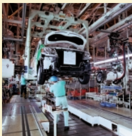
自動車生産システム

搬送システム コンベヤ モノール 無人搬送車 保管システム 自動倉庫 回転式ラック 仕分け/ピッキングシステム 物流機器 ラック パレット カート その他 洗車機 ボウリング 電子機器