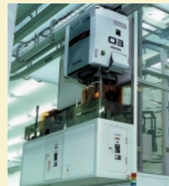
クリーンルーム内搬送・保管システム