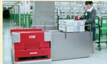
国立国会図書館関西館で図書ケースを搬送。