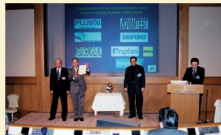
インテル社殿「PQS受賞式」。記念の盾が贈られた。