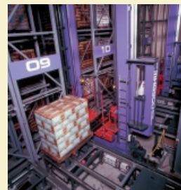
立体自動倉庫システム